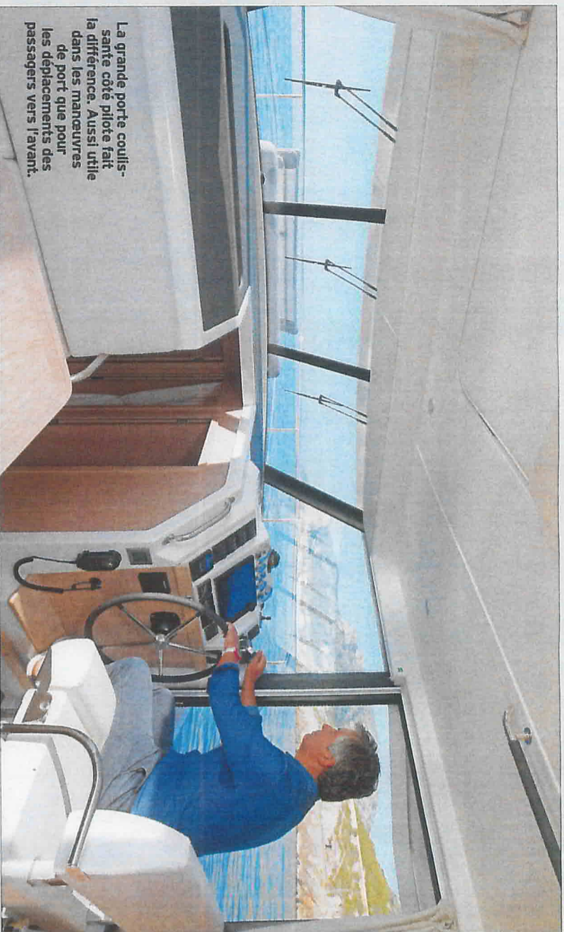
La grande porte coulissante côté pilote fait la différence. Aussi utile dans les manœuvres de port que pour les déplacements des passagers vers l'avant.

+ Des volumes intérieurs conviviaux et intelligents, remarquablement bien optimisés. Beaucoup d'astuces d'aménagements pour faciliter la vie à bord. Une carène éprouvée pour une motorisation rationnable et économique.