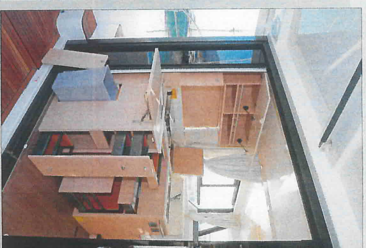
Le bloc cuisine multiplie les tiroirs et les placards et offre des solutions de rangements originales et inédites à l'instar du réceptacle à poubelle intégré.