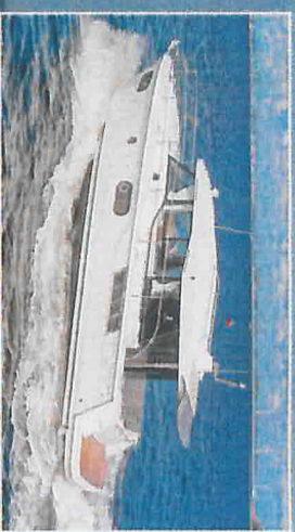
Le Swift Trawler est proposé en version fly ou sedan. Cette dernière dispose d'un toit ouvrant transparent ainsi que pour fixer des kayaks ou des engins de plage sur le top.