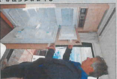
Derrière la colonne frigo se glisse l'écran TV orientable. Une idée lumineuse.