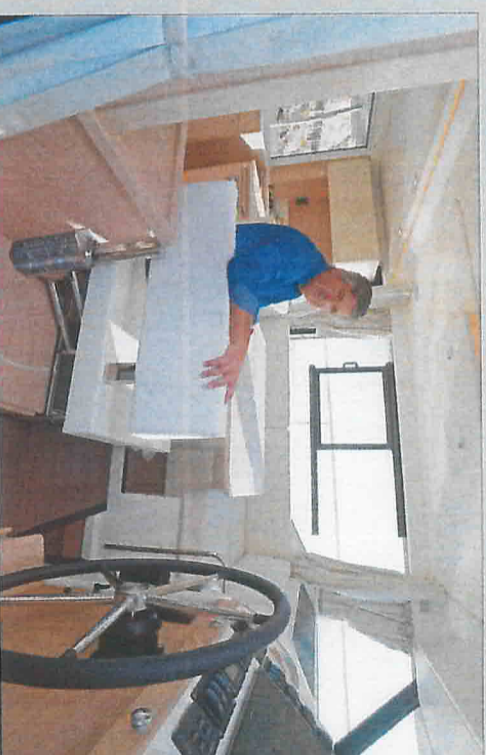
La banquette pivotante change la physionomie du salon. Le mécanisme est simple mais nécessite d'avoir le coup de main.