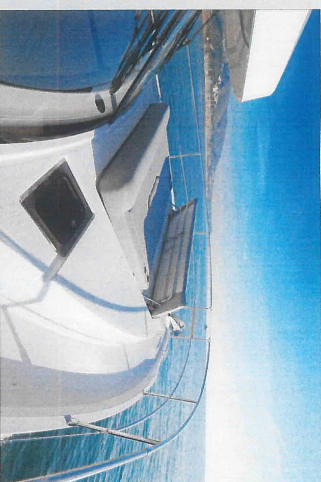
Le matelas du bain de soleil est prolongé par une banquette sur l'avant dont le dossier est relevable. La qualité est au rendez-vous mais l'option se pale cher (4 320 €).