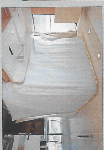
Pour plus d'intimité, le carré convertible en double couchette peut être isolé par un rideau sur glissière.