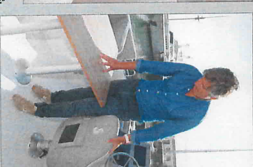
Ca coince au fly ! Entre la table et le fauteuil pilote, le passage est plus qu'étroit. Il va falloir sortir la scie électrique pour couper l'angle de la table !