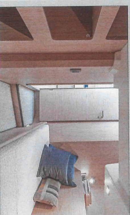
Dans la cabine tribord, un seul lit mais tout un pan d'équipements pour ranger les affaires les plus encombrantes ou y installer une machine à laver séchant.