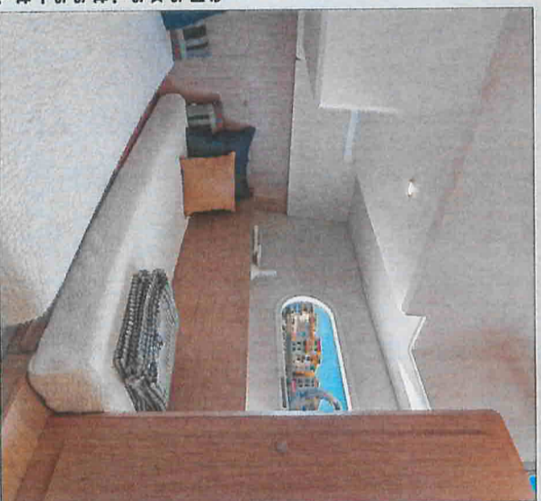
La cabine latérale bâbord et ses lits jumeaux réunissables en un seul. L'espace est lumineux mais les rangements (pendente uniquement) sont un peu chiches.