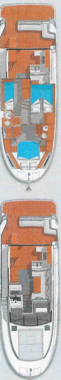
Trois cabines et deux salles de bain : l'optimisation des volumes est remarquable. Le moindre recoin est exploité.